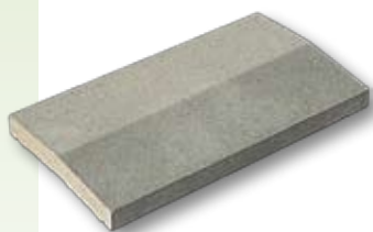
CHR2 - Chaperon 2 pentes

Les chapeaux de piliers et les chaperons de murs Weser sont les éléments de finition indispensables à votre clôture. Ces éléments protègent harmonieusement vos piliers, murets et murs et assurent leur pérennité en évitant la pénétration de l'eau dans la maçonnerie.