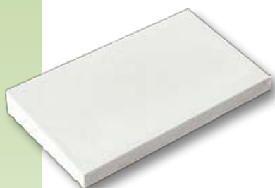
CHR1 - Chaperon 1 pente