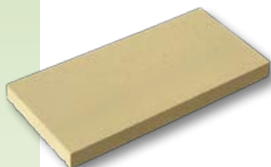
CHR0 - Chaperon plat