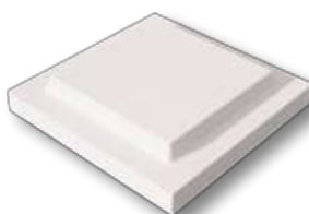
CP0 - Chapeau plat

Le choix de la largeur du chaperon est déterminé par la largeur du mur enduit fini. Les chapeaux et chaperons sont munis de gouttes d'eau.